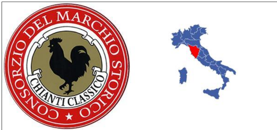
Marchio del Consorzio Chianti Classico ( www.chianticlassico.com )