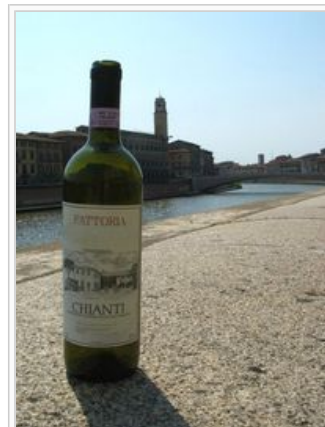
Vin de Chianti supérieur mis en bouteille de forme bordelaise.