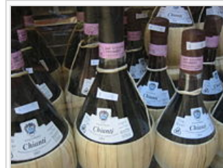
Vin de Chianti ordinaire mis en bouteille en fiasco